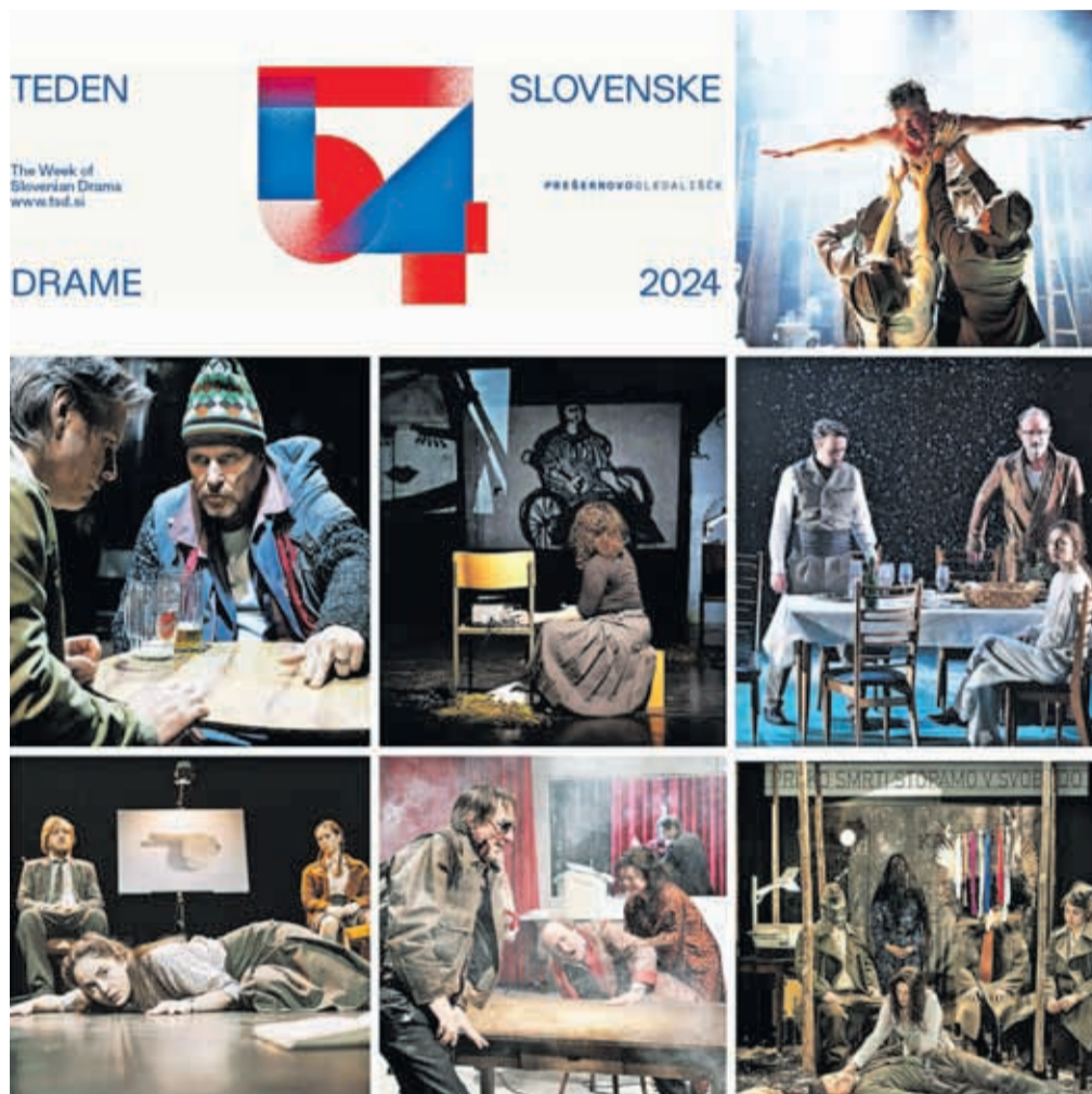
V tekmovalnem programu bomo videli sedem uprizoritev.