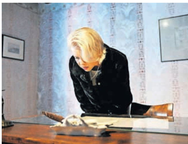
Predsednica državnega zbora Urška Klakočar Zupančič med obiskom Prešernove hiše