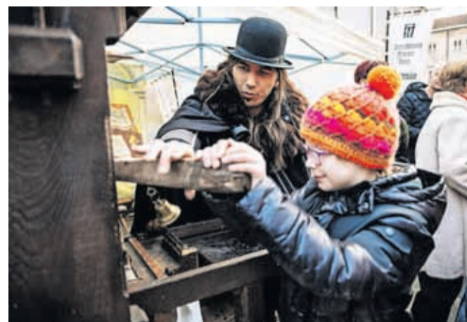
V tiskarni manufakture Mojstra Janeza so se obiskovalci lahko tudi sami preizkusili v ročnem tisku s svinčnimi črkami.