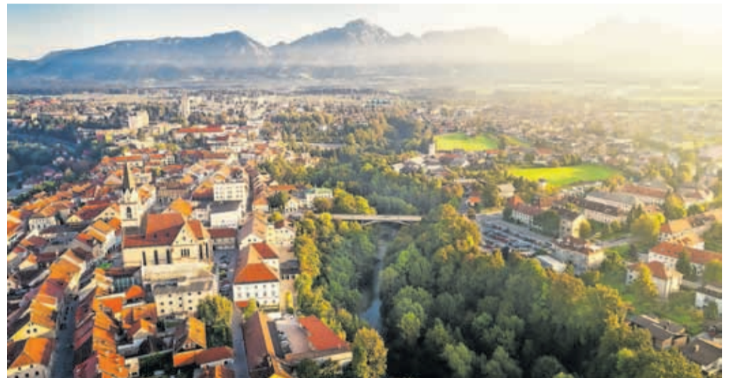
Za osrednjo temo EKO tedna v Kranju so organizatorji postavili zeleno infrastrukturo mesta in okolice.