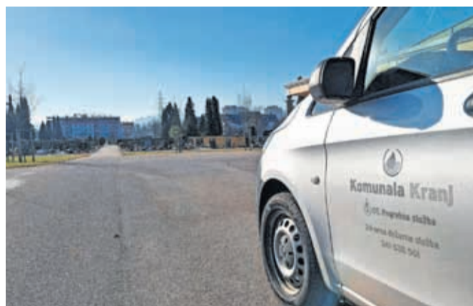
Letošnja pridobitev je novo vozilo za prevoz pokojnikov.