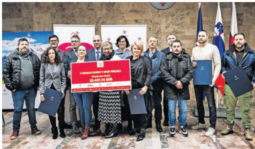
Zaključek dobrodelne akcije V Kranju dobro v srcu mislimo 2024