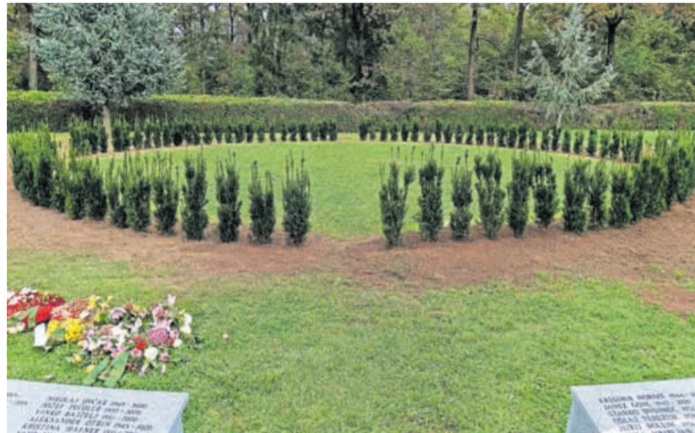
Jeseni je bil preurejen prostor za raztros pepela na Mestnem pokopališču Kranj.

Komunala Kranj po pooblastilu Mestne občine Kranj izvaja tudi upravljanje Mestnega pokopališča Kranj ter Pokopališča Bitnje. Upravljanje obsega tekoče letno in zimsko vzdrževanje, kot sta čiščenje glavnih poti, odprtih javnih površin in objektov ter vzdrževanje zelenja in zelenic. Tekoče vzdrževanje se financira z najemninami grobnih prostorov. Pri tem je pomembno poudariti, da je vzdrževanje grobov, njihove neposredne okolice in pro-