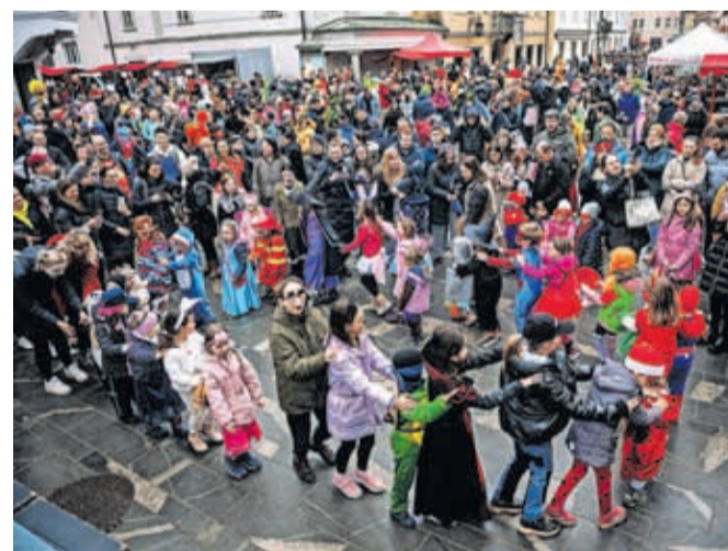
Pustne šeme so na pustno soboto ponovno napolnile mestno jedro Kranja.