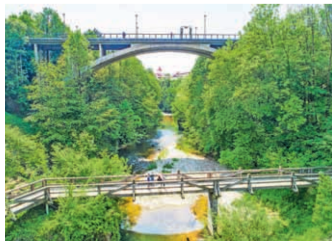
Na predvečer gregorjevega bomo v kanjonu reke Kokre spuščali gregorčke.

V ponedeljek, 11. marca, na predvečer gregorjevega, bomo ob 18. uri v kanjonu reke Kokre spuščali gregorčke. Te si lahko izdelate na delavnici v Kovačnici ob 16. uri. Ker se zavezuemo k trajnostnemu ravnanju, bodo vse barčke, izdelane na naših delavnicah, iz naravnih in razgradljivih materialov, k čemur nagovarjamo tudi tiste, ki bodo barčke izdelali doma. Da ne bi onesnaževali narave in reke Kokre, bomo gre-