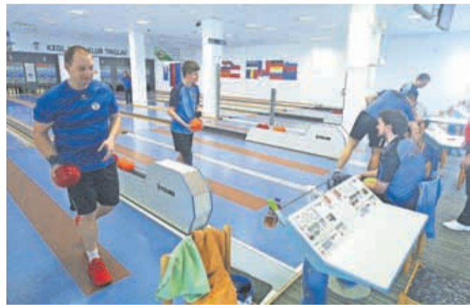
Kegljačem Triglava tudi na sobotni povratni tekmi ni uspelo premagati nemškega Raindorfa.