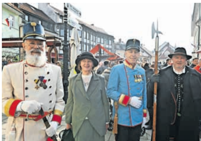
Prešernov smenj je Kranj preoblekel v romantiko 19. stoletja. Po mestu so se sprehajali meščani v opravih izpred skoraj 200 let.

Ulice in trgi starega mestnega jedra Kranja so bili ta mesec dvakrat polni obiskovalcev. Na slovenski kulturni praznik, 8. februarja, je Prešernov smenj v mesto privabil okoli trideset tisoč obiskovalcev, dva dni kasneje, na pustno soboto, 10. februarja, pa so mestno središče napolnile maškare, ki so se udeležile Krančkovega karnevala. Za vas smo izbrali nekaj fotoutrinkov z obeh prireditev.