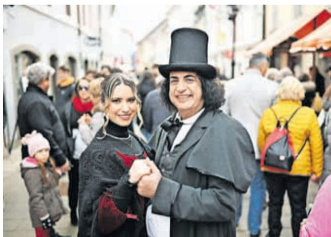
Stalna spremljevalca Prešernovega smenja sta tudi lika Franceta Prešerna in njegove spremljevalke Primičeve Julije, s katerima so se želeli fotografirati številni obiskovalci.