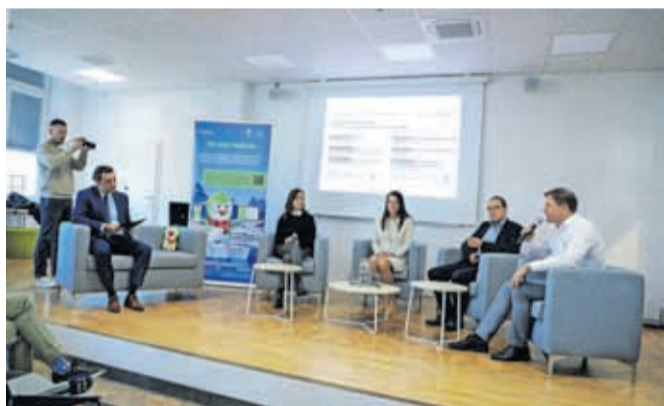
V Kovačnici so predstavili okoljski projekt Zeleni pingvin.

nizacije in celo cela mesta uči, kako zmanjšati izpuste z uporabo manj virov. Zeleni pingvin torej izkorišča pametne digitalne tehnologije, ki otrokom omogočajo spremljanje in beleženje njihovih dejavnosti, zbrane podatke pa združijo oziroma povežejo s podatki o porabi energije in virih šolskih ter drugih stavb. Projekt je delno financiran s sredstvi Norveškega finančnega mehanizma in s sredstvi Ministrstva za kohezijo in regionalni razvoj. Vodilni partner je podjetje Iskraemeco, poleg Mestne občine Kranj pa so vključene še Mestna občina Ljubljana (MOL), DOVES FEE Slovenija – Ekošola ter Foundation for Environmental Education Norway (Fundacija za okoljsko izobraževanje Norveške).