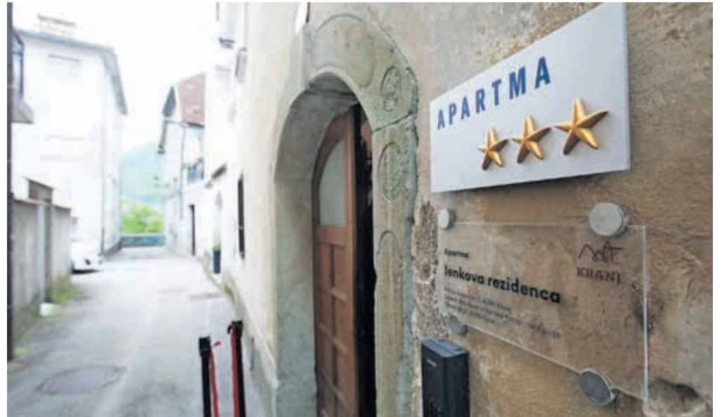
Jenkova rezidenca je poklon pesniku Simonu Jenku, ki je bival v hiši, kjer se rezidenca nahaja.

Društvo Ekologi brez meja, ki so nacionalna Zero Waste organizacija za Slovenijo, med drugim deležnike v turističnem sektorju spodbuja in vključuje v prehod v zeleno gospodarstvo ter trajnostno upravljanje z viri. Da bi Jenkova rezidenca pridobila naziv, smo morali tako zadostiti naslednjim pogojem: ločeno zbranih čez 90 odstotkov odpadkov, uvedba ukrepov za zmanjševanje nastajanja odpadkov, opravljen usposabljanje za zaposlene. A Jenkova rezidenca, kar se tiče trajnostnih ukrepov, presega te zahteve. Jenkova rezidenca je poklon Simonu Jenku, enemu izmed najvplivnejših slovenskih pesnikov, ki je med letoma 1864 in 1866 bival v hiši, kjer se rezidenca nahaja, s čimer želimo navdihovati goste, ki tam bivajo. Po-