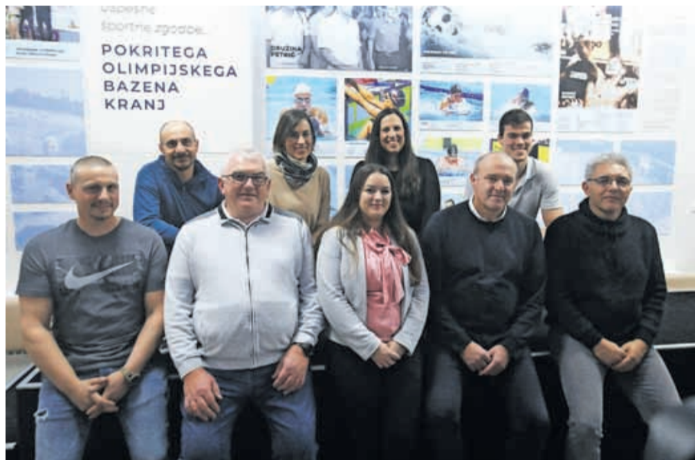
V Galeriji slavnih so predstavljene najboljše športne zgodbe plavalcev in vaterpolskih ekip, ki so se kalili v kranjskem bazenu.