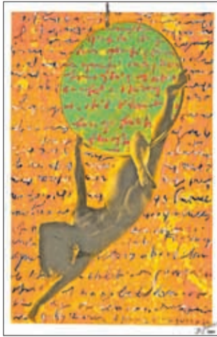
Zoran Ogrinc in Boštjan Gunčar

Kranj – V galeriji Kranjske hiše bo od 4. marca do 7. aprila svoja dela iz projekta Sodelovanja razstavljal kranjski fotograf Boštjan Gunčar. Eden najbolj prepoznavnih kranjskih fotografov se je konec osemdesetih let preteklega stoletja uveljavil s fotografijami ženskega akta v črno-beli tehniki. Temu fotografskemu motivu se kontinuirano posveča. S projektom Sodelovanja se je odločil za dialog med fotografijo in slikarskimi izrazi ter svoj fotografski svet ponudi slikarjem in drugim likovnim ustvarjalcem kot izhodišče za udejanjenje njihovih likovnih razmišljanj. Od tod tudi naslov fotografsko-likovnega projekta Sodelovanja. Spremembo besede k razstavi je pripravil ddr. Damir Globočnik, ki o Gunčarjevi fotografiji pravi, da gre za zvrst t. i. lepega akta. Fotografija, kot pravi ddr. Globočnik, je dokument, v drobci ujeta podoba, ki je nastala brez odtisa človekove roke. Vendar je fotografija akta, tj. golega človeškega telesa, tisti motiv, ki fotografijo morda najbolj povezuje s slikarstvom in kiparstvom. O sodelovanju pa