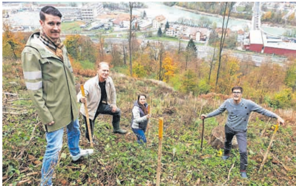
KS Gorenja Sava – zasaditev tisočih sadik dreves