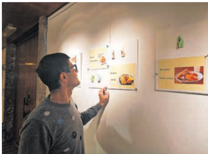
V občinski galeriji poteka razstava izdelkov otrok iz japonskega mesta Fukui.