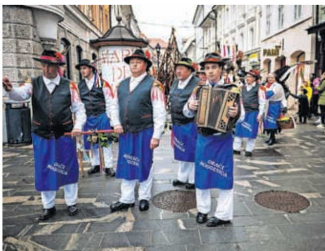
Gostje na Krančkovem karnevalu so bili tudi kurenti in orači iz Rogoznice. Prvi so odganjali zimo, drugi pa napovedovali dobro letino.